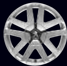
Cerchi in lega 17" Oltis