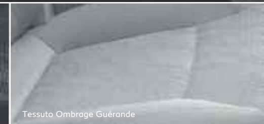
Tessuto Ombrage Guérande