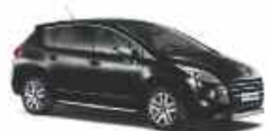
Nero Perla Nera