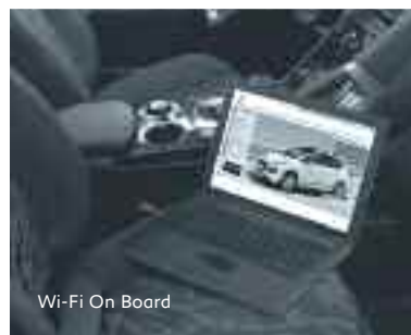
Wi-Fi On Board

Nell'ambito di una politica di costante aggiornamento del prodotto, Peugeot si riserva di modificare in qualsiasi momento le caratteristiche tecniche, gli equipaggiamenti, le opzioni e i colori. Le attuali tecniche di riproduzione fotografica non consentono una riproduzione fedele dei colori. Pertanto questo catalogo, che fornisce informazioni di carattere generale, non è un documento contrattuale. Per qualsiasi precisazione o per ulteriori informazioni consultate il vostro Concessionario. Gli elementi di questo catalogo non possono essere riprodotti senza esplicita autorizzazione di Automobiles Peugeot.