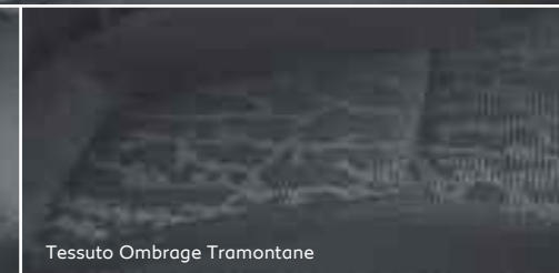
Tessuto Ombrage Tramontane