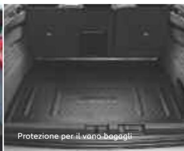
Protezione per il vano bagagli