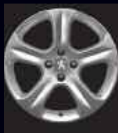
Cerchi in lega 18" Exona