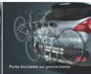
Porta-biciclette sul gancio traino