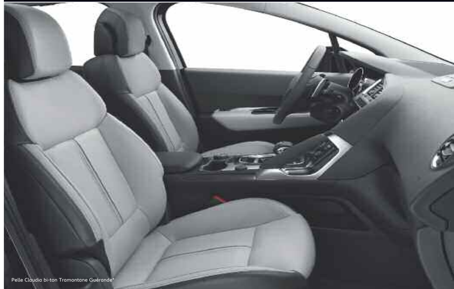
Pelle Claudia bi-ton Tramontane Guérande*

Scegliete tra i numerosi rivestimenti interni per creare un'atmosfera accogliente e raffinata.