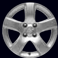
Cerchi in lega 16" Isora

Personalizzate la vostra 3008 HYbrid4 scegliendo i cerchi più adatti al vostro stile.